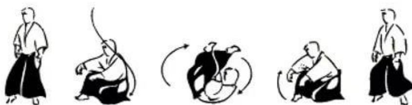
Рисунок 3 - Укеми

Одной из специальных части тренировок является «накатывание» укеми, кувырков вперед, назад, страховки на бок и спину. Они развивают в детях ощущение тела в пространстве, учат управлять своим телом в любом положении, устраняют страх упасть, быть опрокинутым. Физическая польза укеми заключается не только в развитии пресса, мышцы спины, шеи и ног. Эта часть тренировки имеет важное значение для развития выносливости и координации, а также для сохранения здоровья и жизнью занимающихся.